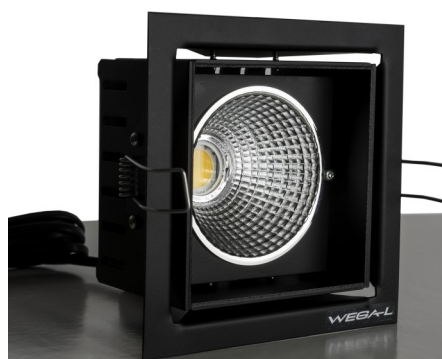
Svart / Black

Cube DL Food Fresh LED är en specialutgåva av LED-spotlighten Cube DL LED , för belysning av "frukt & grönt", chark-, bröd- och blomavdelningar etc.